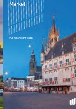
VVE COMBI MISE 2018