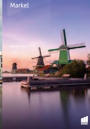
BND ZZP MISE 2018