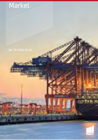
BA TB MISE 2018