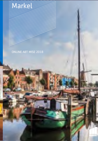
ONLINE ABT MISE 2018