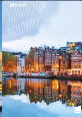
BA BRU MISE 2018