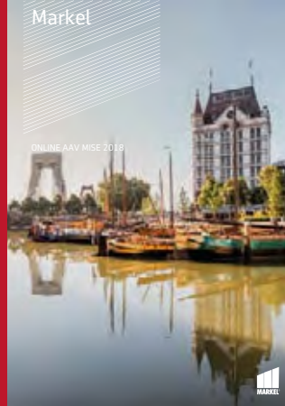
ONLINE AAV MISE 2018