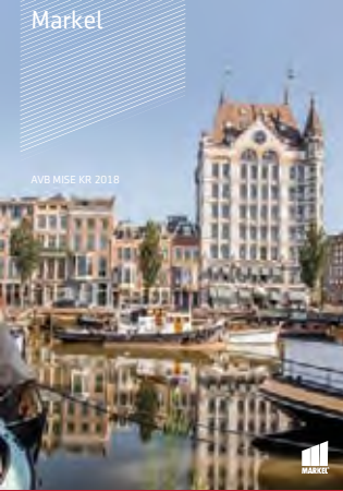
AVB MISE KR 2018