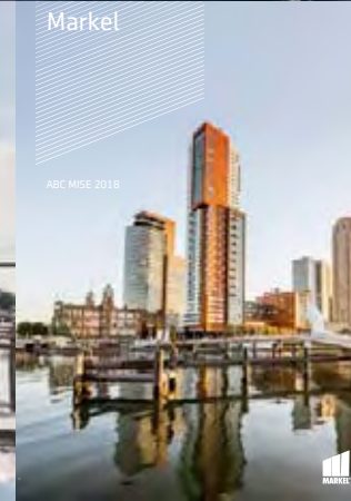
ABC MISE 2018