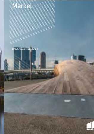
BND ALG MISE 2018