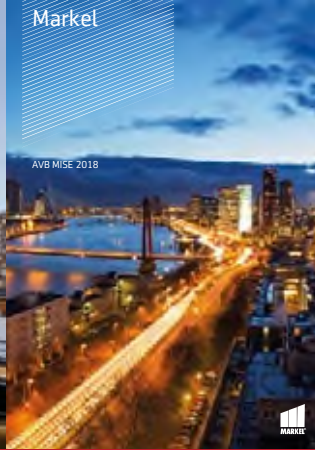
AVB MISE 2018