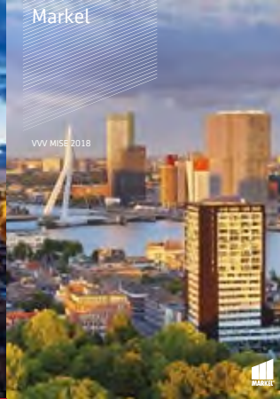
VVV MISE 2018