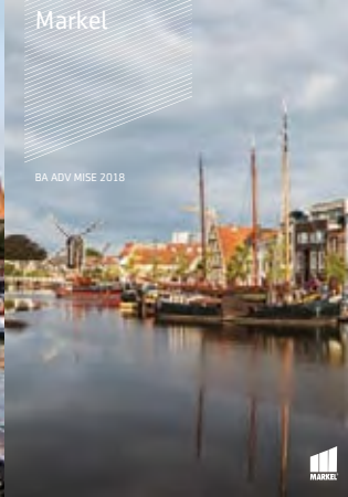
BA ADV MISE 2018