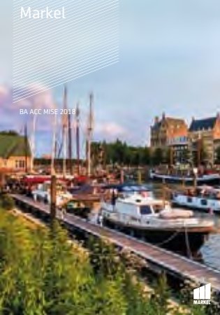
BA ACC MISE 2018