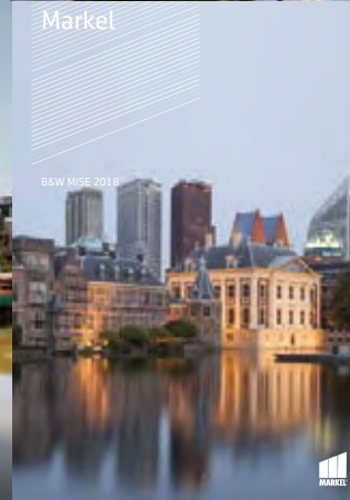
B&W MISE 2018