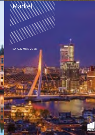
BA ALG MISE 2018