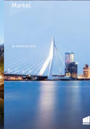
BA ADM MISE 2018