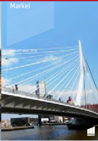
BND ZZP MISE 2018