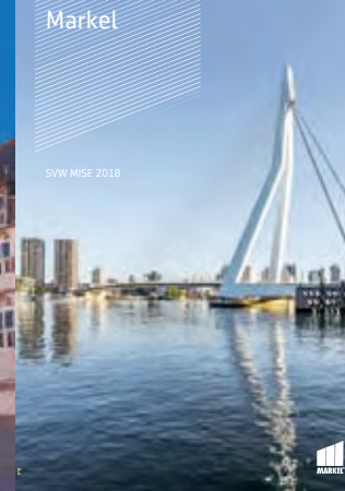
SVW MISE 2018