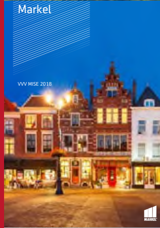
VVV MISE 2018